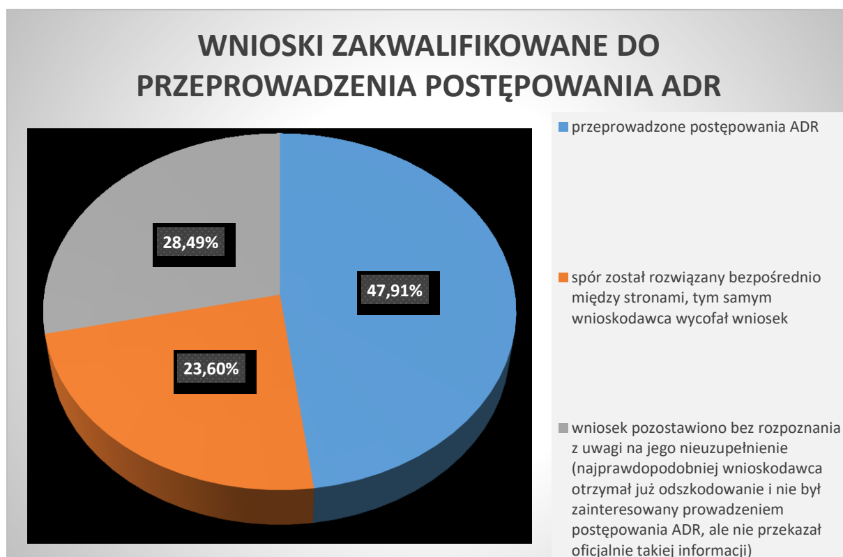
Wykres 2. Wnioski zakwalifikowane do przeprowadzenia postępowania ADR

Do przeprowadzenia postępowania ADR zakwalifikowanych zostało 1987 wniosków (51% wszystkich rozpatrzonych w 2023r. wniosków), z czego w 23,60% (469 spraw) - z reguły po wezwaniu do uzupełnienia wniosku - wnioskodawcy wycofali wnioski przed zawiadomieniem drugiej strony o postępowaniu ADR z powodu wcześniejszego rozwiązania sporu, a w 28,49% (566 spraw) wnioskodawcy po zwróceniu się Rzecznika o uzupełnienie wniosku nie odpowiedzieli, co najprawdopodobniej oznacza, że spór również został już rozwiązany, wnioskodawca otrzymał już odszkodowanie i nie był zainteresowany przeprowadzeniem postępowania ADR, ale oficjalnie nie przekazał takiej informacji. W 47,91% (952 spraw) przeprowadzone zostało postępowanie ADR.