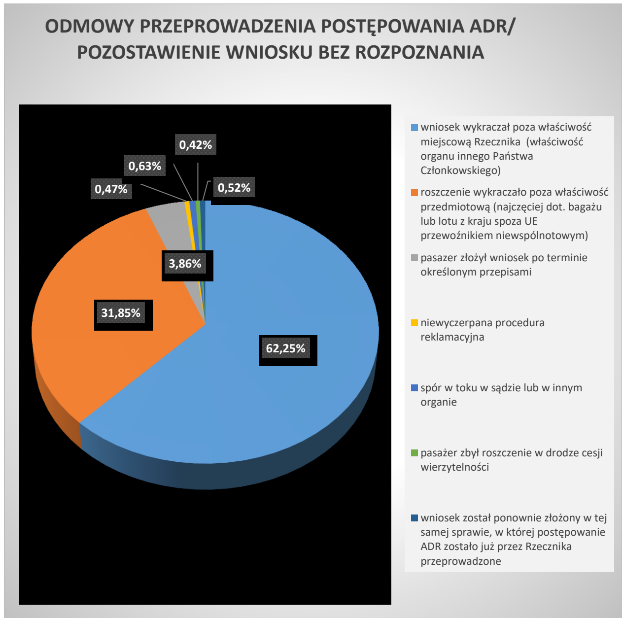
Wykres 4. Przesłanki odmowy przeprowadzenia postępowania ADR / pozostawienia wniosku bez rozpoznania

Rzecznik pozostawił wniosek bez rozpoznania / odmówił przeprowadzenia postępowania ADR w przypadku 1915 wniosków, co stanowi 49 % wszystkich wniosków rozpatrzonych w 2023 roku. W 62,25 % z tych przypadków wniosek został złożony do niewłaściwego organu (według podziału właściwości Państw Członkowskich UE zgodnie z rozporządzeniem 261/2004/WE, kompetencje Rzecznika zostały określone w art. 205a ustawy Prawo lotnicze) a w 31,85 % przypadkach przedmiot roszczenia wykraczał poza kompetencje przedmiotowe Rzecznika (głównie dotyczyły bagażu lub zakłóconego lotu rozpoczynanego z państwa spoza UE przewoźnikiem nie wspólnotowym). W 6,21 % przypadkach wniosek został złożony po terminie wymaganym przepisami art. 205a ust. 15 ustawy Prawo lotnicze. Pozostałe przypadki to: w 0,47 % nie została wyczerpana procedura reklamacyjna, w 0,63 % spór był w toku w sądzie lub rozpatrywany przez inny organ, w 0,42 % pasażer zbył wierzytelność w drodze cesji, w 0,52 % wniosek został złożony ponownie w tej samej sprawie, w której postępowanie ADR zostało już zakończone.